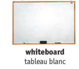
whiteboard tableau blanc