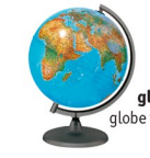
globe globe terrestre

I LOVE ENGLISH FOR KIDS - SEPTEMBER 2018